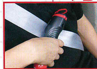
シートベルトカッター