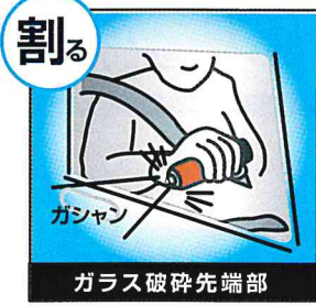
ガラス破碎先端部