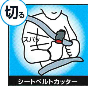
シートベルトカッター