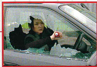
ガラスクラッシャー (ゴムキャップを装着したまま破碎可能)